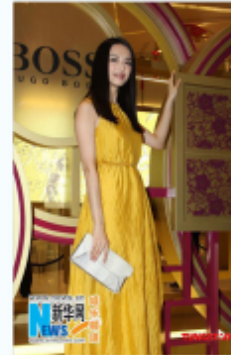
“时尚女王”上一日两变身

已经由她变身“时尚女王”的艺人姚晨近日在新年、红毯日、婚礼上频频亮相，参加了两个活动。不同的场合她展现出不同的风采，展现她成熟优雅气质。时尚网“时尚女王”活动专题。