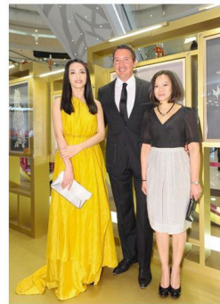
2012年亚洲限定版BOSS Black Dragon龙系列

为庆祝此系列的推出，品牌特别邀请美籍华人著名剪纸艺术家李宝怡女士，以“花中四君子”梅兰竹菊之首的梅花为主题，选取中国传统文化中代表祥和之意的如意图腾为创作灵感，以极具东方色彩的剪纸艺术为表现手法，为亚洲区特选的16家BOSS Black精品店设计出充满农历新年气氛的橱窗布置。同时借此机会，BOSS Black 特聘李宝怡女士，于上海浦东陆家嘴中央核心商务区国际金融中心（IFC）一楼中庭举办以其剪纸作品和BOSS Black 最新推出的限定版龙系列为主题的跨界艺术展，展览从1月18日至18日为期9天，共展出12件李宝怡女士近期创作的剪纸艺术作品。