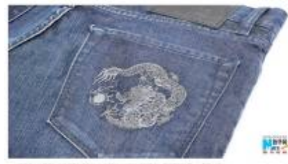
2012 BOSS Black Dragon系列牛仔裤，"BOSS" "Dragon" 系列...

Event coverage on Xinhuanet.com - 19th Jan. 2012