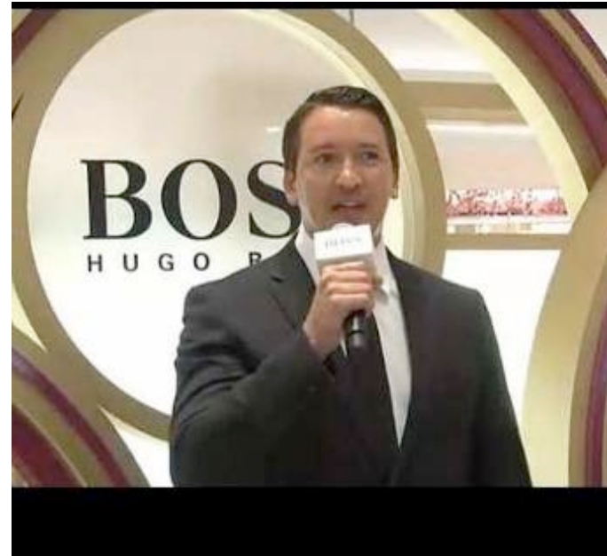
Event coverage on Video.suke100.com - 18 th Jan. 2012