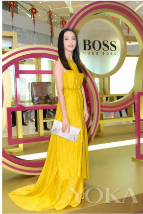
著名影星姚晨小姐

近日，HUGO BOSS旗下知名奢侈品牌BOSS Black凭借对东方摩登生活的理解和对品牌创新的诠释，倾力推出2012 BOSS Black Dragon龙系列，该系列专为亚洲限定制作，以祥云图腾为设计主题，隆重庆祝即将到来的中国龙年。