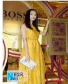
“时尚女王”一日两变身