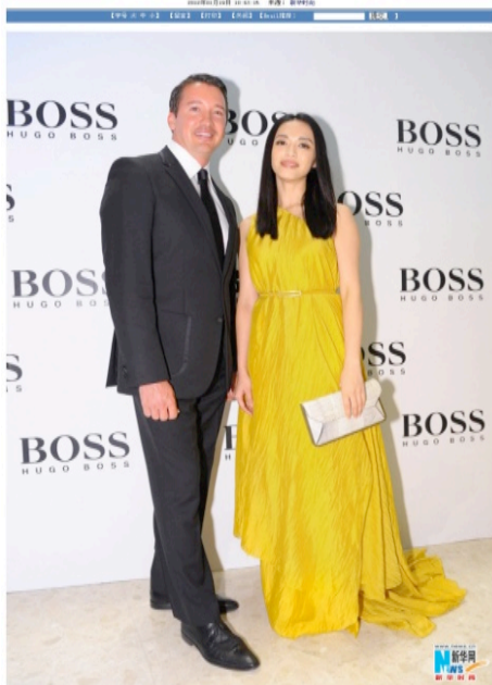
近日，HUGO BOSS旗下知名男装品牌BOSS Black 再度携手东方摩登潮流的领袖和时尚品牌设计师，倾力推出2012 BOSS Black Dragon系列...