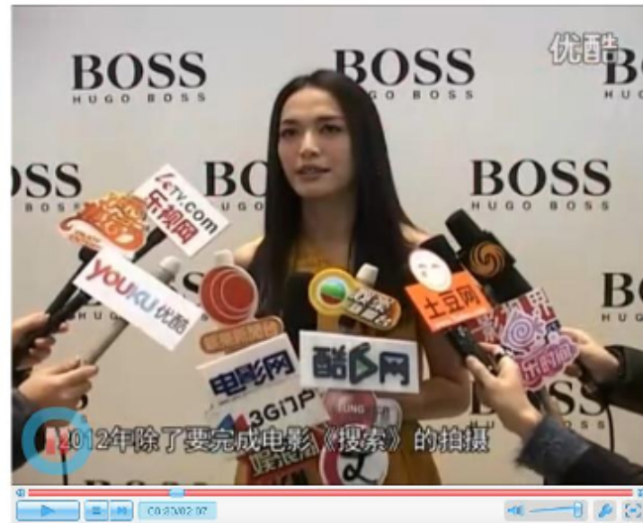
Event coverage on Youku. com - 18 th Jan. 2012