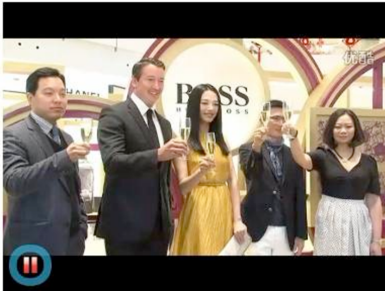
Event coverage on Youku. com - 14 th Jan 2012