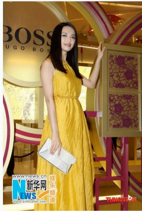
“时尚女王”沪上一日两变身

已经成功晋升为“时尚女王”的艺人姚晨近日工作不断，仅仅昨日，她就在上海接连参加了两个活动，不仅精神饱满地接受两拨媒体的采访，服装造型更是再度变身，对高超“时尚女王”这个称号，记者问她 2012年的新年愿望时，她默认“脱单（找对象）”是个重要心愿，只不过对于对象的要求，姚晨坦言说：“好像也没什么具体要求。”