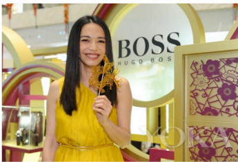
欣赏高雅艺术的同时享受光耀的耀耀，寓意吉祥吉祥

全新 2012 BOSS Black Dragon龙系列以休闲服饰和箱包皮具为主线，在材质用料上始终坚持一丝不苟，选用最新研发的特殊工艺，兼顾功能性和实用性，并将中国传统文化中代表祥和之意的祥云图腾融入产品设计中，秉承一贯简约时尚的设计风格 and 精益求精的制作工艺，又一次完美诠释了摩登硬朗的男性形象，而品牌对原创生活方式的推崇也在全新系列中淋漓尽致地展现。