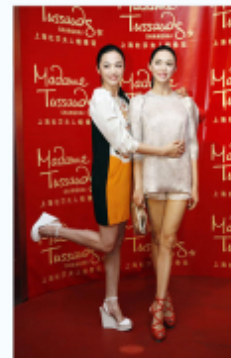
“时尚女王”上一日两变身

Event coverage on 163.com - 14 th Jan. 2012