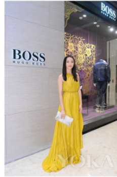
著名影星姚晨小姐在BOSS HUGO BOSS店前留影

秉承一贯的，霍建华将事件转变，HUGO BOSS 汲取中国的传统习俗，精心制作最新新年贺岁系列，创意设计巧妙地运用祥云图腾及珠宝女士创作的梅花和纸团图案，两者相呼应，在装饰寓意和材质的同时，更赋予成衣更加喜庆吉祥的美好寓意。